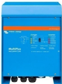
Phoenix Wechselrichter 24/5000