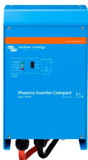
Phoenix Wechselrichter Compact 24/1600

Die Möglichkeiten mit parallel geschalteten Wechselrichtern sind tatsächlich erstaunlich. Vorschläge, Beispiele und Kapazitätsberechnungen können Sie in unserem Buch 'Immer Strom' nachlesen. (Kostenfrei erhältlich bei Victron Energy und herunterladbar von www.victronenergy.com ).